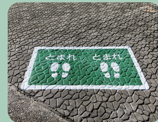
とまれ W1200×H700mm 【AS-255】 石川県