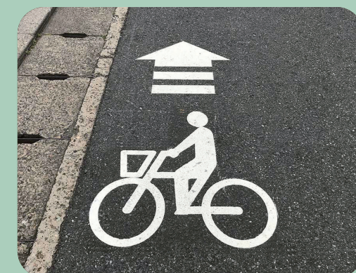
自転車マーク W750×H862mm 直進矢印: W630×H689mm 【J-M-126 / Y-C-303】 千葉県