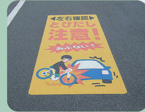
とびだし注意 W1020×H3000mm 【D-JC-9C2】 福井県