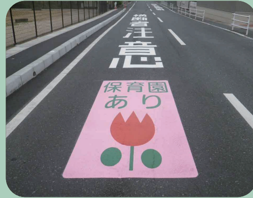
保育園あり W1200×H3000mm 【D-TWN-298】 岡山県