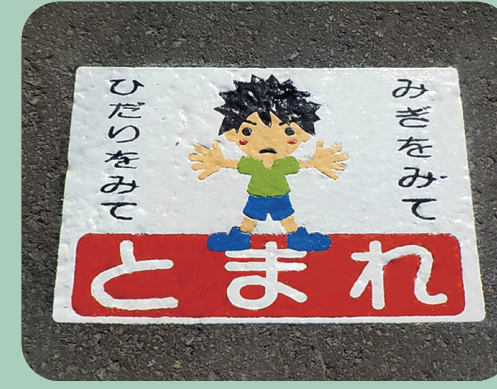
とまれ W600×H400mm 【D-T-87C5】 北海道