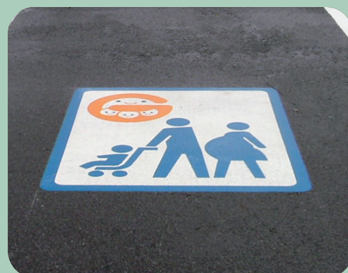
ファミリーマーク W1000×H1200mm 【D-B-10】 岐阜県