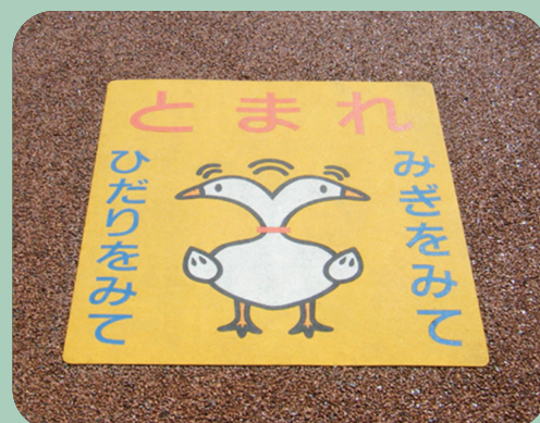
とまれあひる W600×H700mm 【D-T-59】 埼玉県