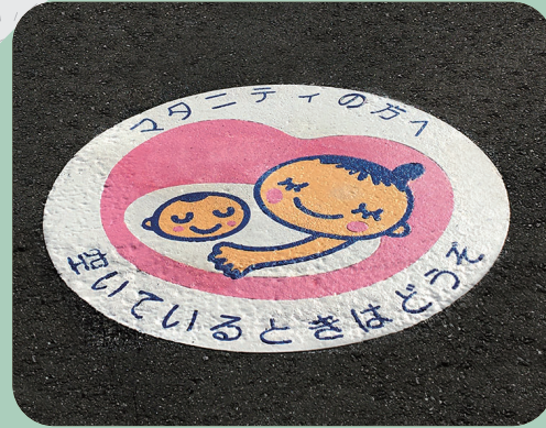
マタニティの方へ φ900mm 【MB-D-3 S1C2】