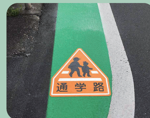
通学路 W400×H457mm 【D-SZ-26D3】 東京都