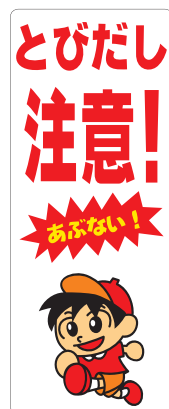
クイックシート【D-注-78C2】 1000×2500mm