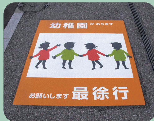
幼稚園があります W1100×H1300mm 【D-TWN-52S2】 石川県