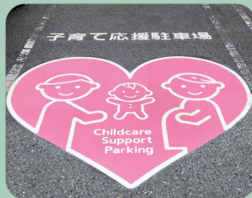
子育て応援駐車場 W2000×H1700mm 【D-B-615S2】 鳥取県