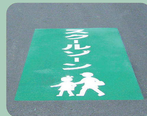
スクールゾーン W1000×H2000mm 【D-SZ-2】 山口県