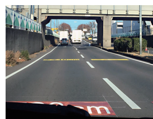
冠水標示 W2500×H1200mm【DM-1663 他】埼玉県ふじみ野市