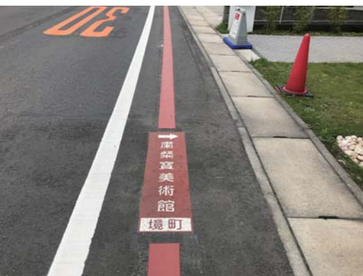
クイックシート 茨城県 W300×H1150mm 【D-JO-810】