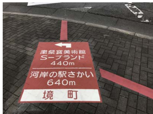
クイックシート 茨城県 W1000×H1350mm 【D-JO-806】