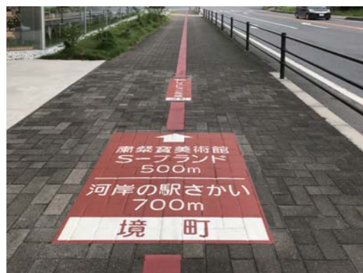
クイックシート 茨城県 W300×H1150mm / W1000×H1350mm 【D-JO-804 / D-JO-805】