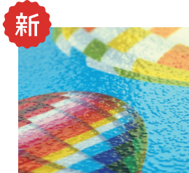
ガラスビーズタイプ