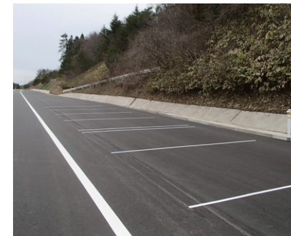
■ 仮設駐車スペース