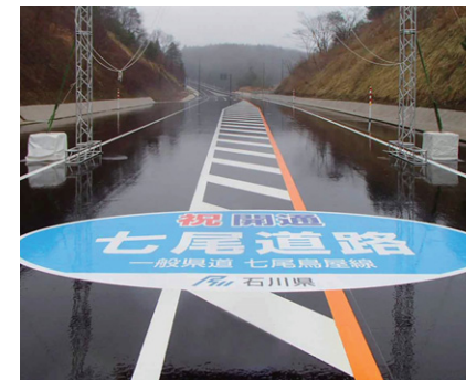
■ 開通式会場ゲート下の装飾