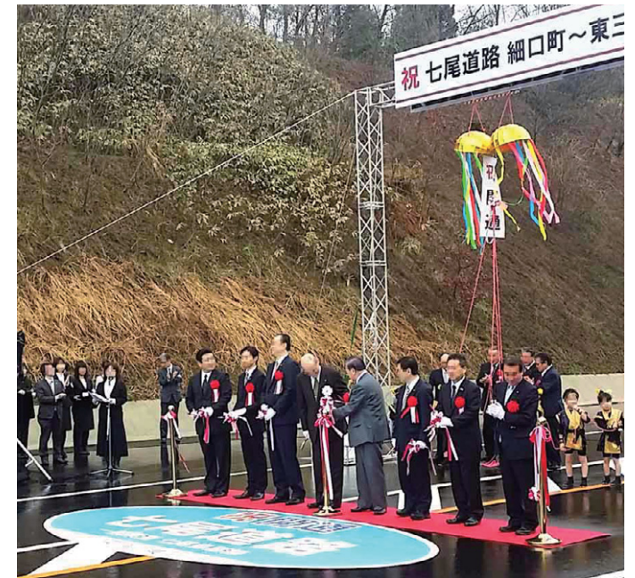
■ テープカットの様子

今回は工事のイメージアップの一環として、「開通式会場の路面装飾」と「仮設の駐車ライン」をご提案しました。他では見ない珍しい物であったことから発注者の反応も良く、すぐに採用が決まりました。