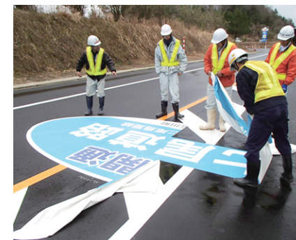
■ 式典終了後すばやく撤去できます