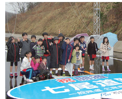
■ 地元の子どもの記念撮影