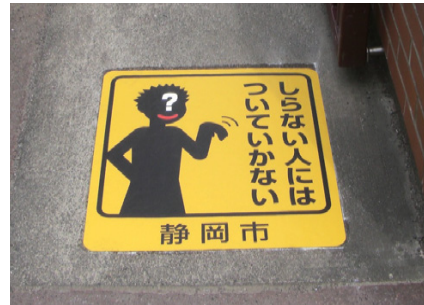
■ 採用されたクイックシート