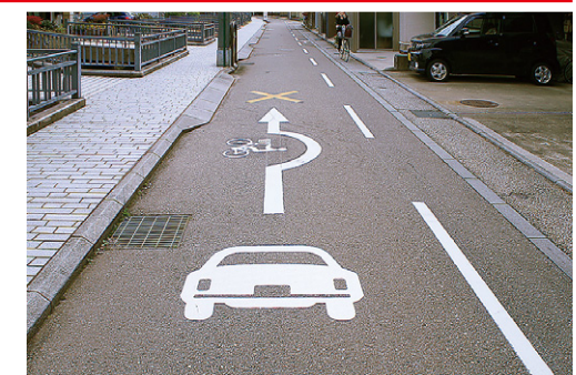
自転車走行指導帯【JH-M-20・JH-M-21】 金沢市