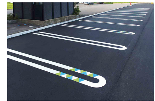
駐車場デザインライン W504×H1245mm 津幡町