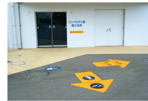
誘導サイン のとじま水族館【D-TWN-132】 W1200×H1500mm 七尾市