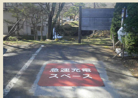
急速充電スペース【DM-995】 W1500×H1500mm 福島県 常磐市