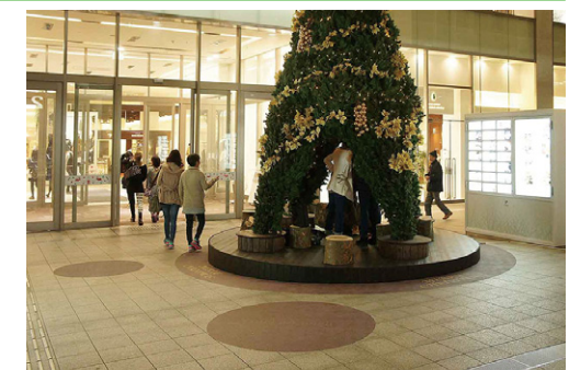
装飾 クリスマスイルミネーション 金沢市