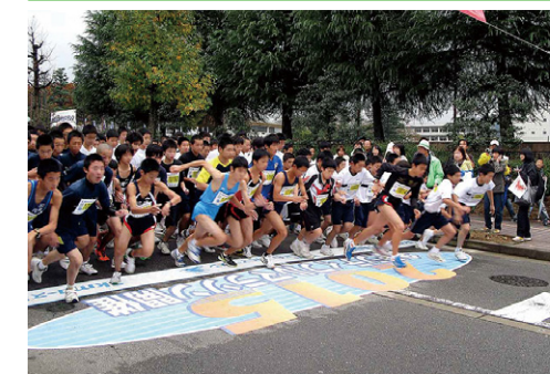
スタートサイン マラソン大会 W7700×500mm・W6740×1700mm 金沢市