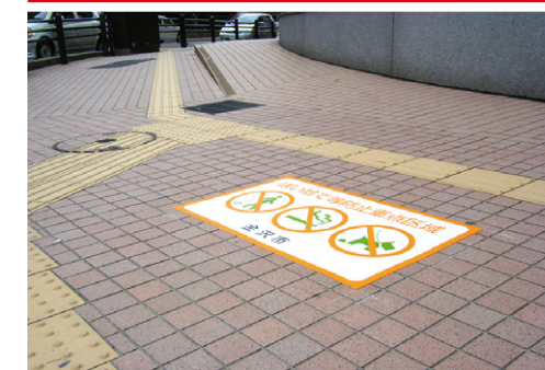
ほい捨て等防止重点区域【D-TA-40】 W1000×H600mm 金沢市