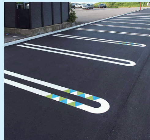
駐車場デザインライン