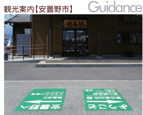
長野県 安曇野市 W1000×H1400mm 【D-TWN-93】

観光客が初めて訪れる街で安心・快適に観光できることはとても大切です。誘導サインを駅前の路面に標示することで観光客を目的場所へスムーズに誘導することができます。通行の妨げにならない路面標示は安全にも配慮しています。