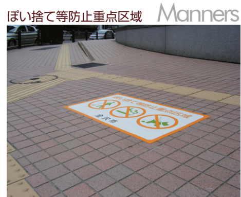
石川県 金沢市 W1000×H600mm 【D-TA-40】

道路、公園、駅などの公共空間は様々な人が利用します。安心・快適に空間を利用するには、利用者がマナーを守ることがとても大切です。歩道をキレイに保つため駅周辺の路面にポイ捨て禁止マークを表示し、マナーアップの意識を高め、観光に適した環境をつくります。