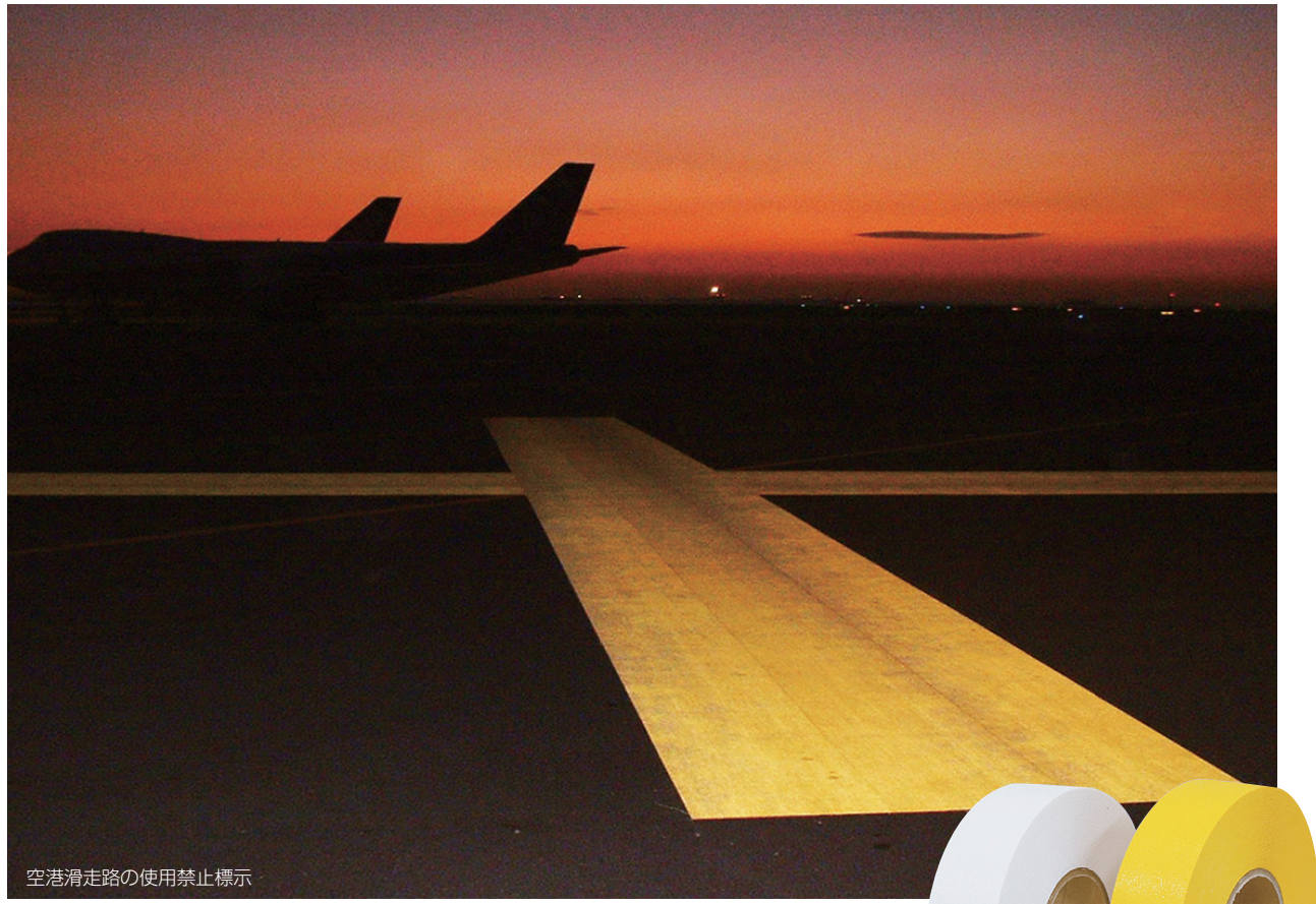
空港滑走路の使用禁止標示