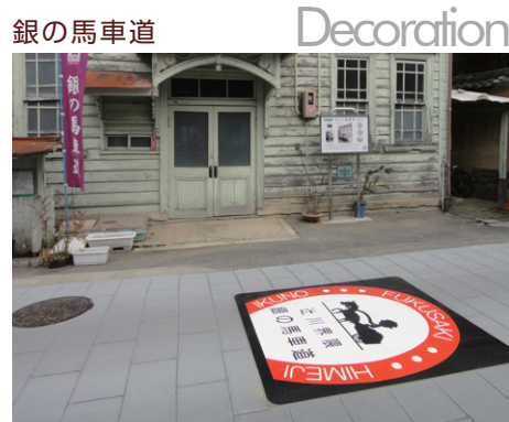
兵庫県 福崎町 W1500×H1700mm 【D-TWN-112】

観光客が多く訪れる街で楽しく観光できる環境を作ることはとても大切です。姫路市から朝来市生野町間の間に「馬車の道」という観光名所があり、そこで装飾を路面に標示することで観光客をもてなす演出がされました。