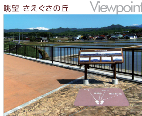
石川県 加賀市 W1200×H1300mm 【D-TWN-128】

観光名所でのビューポイントは路面標示が最適なサインの一つです。道の駅にある展望台からの眺めで、それぞれの山かダイレクトに方向を案内できます。また通行の妨げにならない路面標示は安全にも配慮しています。