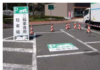
二輪車専用駐車場：W1250×H1000mm

工事やイベントなどに伴う臨時駐車区画の整備を行う際、仮設の路面標示として使用されました。看板と併せて路面にも標示を設置することにより、わかりやすい駐車区画になります。