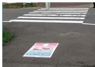
トキメキ新潟国体：W600×H1200mm

通行者をイベント会場や各種施設へ導くための誘導案内として使用されました。路面に設置することにより直接方向を示すことが出来るため、より確実な誘導が可能です。