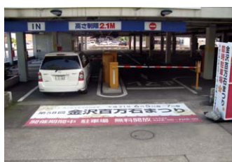
金沢百万石まつり：W5000×H1800mm