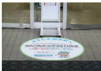
ねりんピック 2011 熊本：Φ1000mm