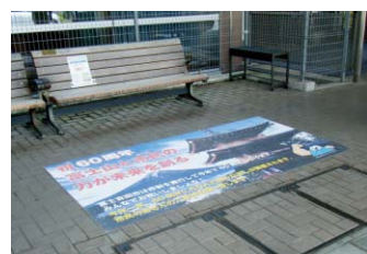
富士吉田市政 60 周年：W2400×H1200mm