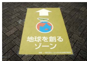
エコライフステージ 2012：W800×H1250mm