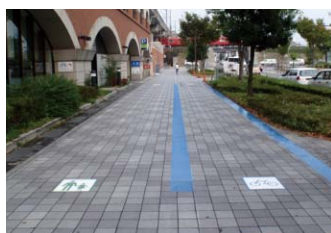
自転車・歩行者区分：W450×H450mm