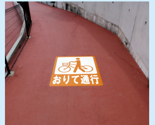
サイズ: W800×H1000 mm 設置場所: 福島県 【J-D-14】

また、道幅の狭い歩道や通行量の多いアーケード街などで、自転車レーン設置や自転車・歩行者区分等の整備がとり難い場所に有効です。