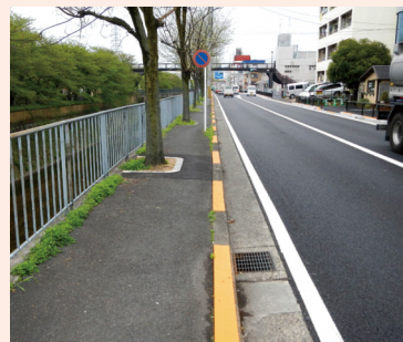
縁石部分の注意喚起