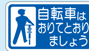
サイズ: W800×H1000 mm 【J-D-141】