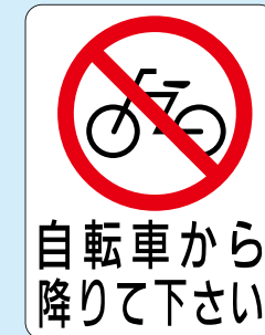
サイズ: W450×H600 mm 【J-D-205】