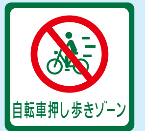
サイズ: W600×H600 mm 【J-D-232】