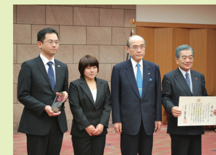
授賞式 平成24年3月21日

当社は、特に“女性が働きやすい企業”を目指し、女性が多い部署では、女性を上長にする取組みを行ってきました。近年は所定時間外労働の削減、休業・休暇の取得促進等に積極的に取り組み、それらの活動が評価され、『石川県ワークライフバランス企業知事表彰』で、『子育て社員サポート特別賞』を授賞致しました。