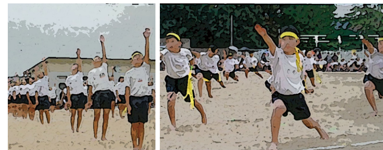
「若い力」を踊る金沢市内の小学生。金沢市内の小学校が一堂に集まる連合体育大会でも毎年披露される。

また、第2回石川県大会より、国体シンボルマークと大会歌が制定されました。この時に大会歌として作られたのが「若い力」です。「若い力」は金沢市内小学校の運動会を踊るのが恒例となり、現在も変わらず踊り継がれています。70年以上も受け継がれてきた大会歌が、大会当時の盛り上がりや初回の地方大会の成功を今に伝えています。