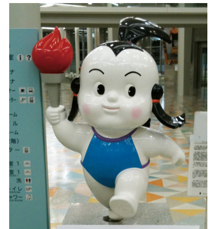
加賀人形をモチーフにした第46回石川県大会(1991年)のマスコット「げんきくん」