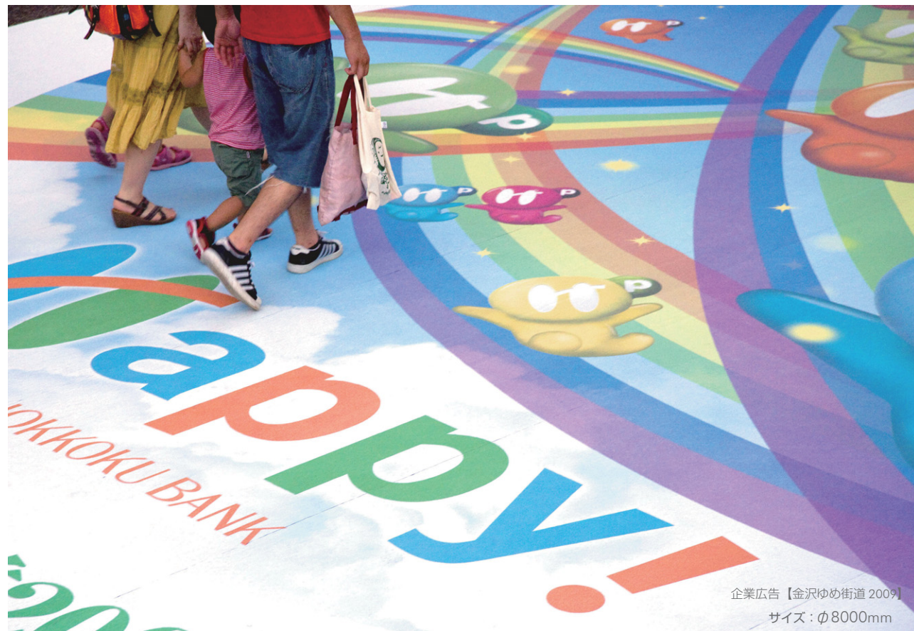
企業広告【金沢ゆめ街道 2009】 サイズ：φ8000mm