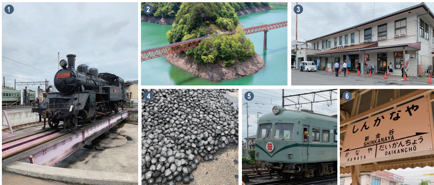
① 新金谷駅車両工場の転車台 ② ダム湖の真ん中にある奥大井湖上駅。鉄道でしか行くことができない秘境駅。③ 大井川鐵道の本社がある新金谷駅。④ 石炭。大井川鐵道のSLに適合するように石炭を粉碎し再形成したものを使用している。⑤ 南海電鉄で1997年まで使用されていた21000系。⑥ レトロな新金谷駅の駅名標。

B 新金谷駅から転車台・車両工場見学受付への誘導標示 W500×600mm (PY458)