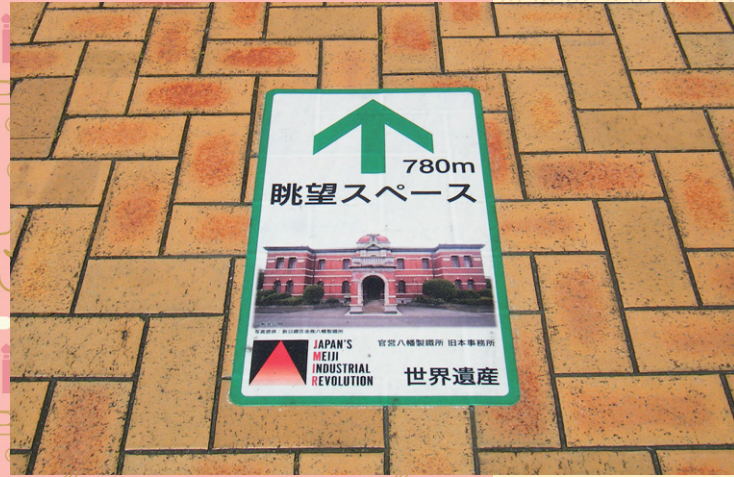
パルシート W400×H700mm 福岡県 北九州市 PY32

今月号は様々な観光地で設置されている路面標示について特集しました。観光地でどのように路面標示が活用されているか、ぜひご覧ください。