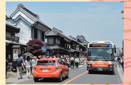
観光客で賑わう休日の川越市街地