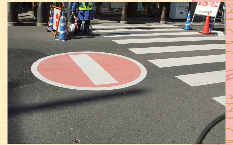
グランシールシート φ2000mm 埼玉県 川越市 GS0021

訪れた観光客の安全を確保するため交通整備を行うことも大切です。「小江戸川越」で知られる埼玉県川越市。江戸情緒を残す、蔵造りの街並みは伝統的建造物群保存地区になっています。江戸時代からの狭い道路に幹線道路としての交通や観光の交通も集中する状態となり、歩行者の安全な通行が難しくなっていました。そこで景観を守りながら、よりよい交通を模索するため「交通社会実験」が行われました。交通量の多い区間の歩道を広げ、車道を一方通行にし交通量等の調査を行いました。この交通社会実験で、車両進入禁止と示すグランシールシートと、車線変更のためにサポートラインが活用されました。