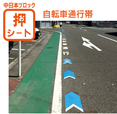
W250×H500mm 静岡県【D-J-310 他】 東海エリアでは自転車通行帯の整備が進んでいます。数量が多いので、通常は塗料で施工する部分もクイックシートを使っていただいています。(能田)