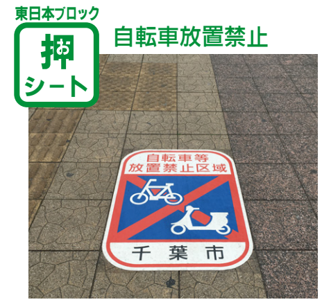
W600×H840mm 千葉県【JHK-147】 放置自転車が多くの問題になっていました。クイックシートが自転車放置禁止対策に役立てられています。(宮崎)

広いと感じたが、北海道はさらに広くて驚いた」そうです。鉄道が多い関東。東京担当の戸村は「駅構内の路面標示が日本で一番多いと思う」と話していました。また、「快晴日数 No.1」を誇る埼玉県はじめ、関東は天候が良いので自転車人口も多く、「自転車関連の路面標示シートがたくさんある」と埼玉、千葉担当の宮崎。東京オリンピックに向けての整備も進んでおり、当社製品もお役に立ればと思います。