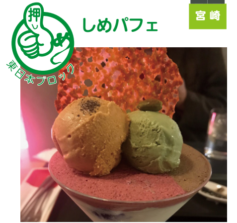
今札幌ではお酒を飲んだ後の「締めのパフェ」が人気です。意外な組み合わせですが、ハマります。ぜひお試しください！(山本)