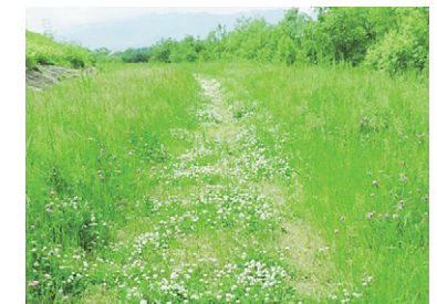
穏やかな気持ちになる新緑

また安心・安全を象徴する色であり、非常口のマークや津波避難誘導サインにも緑色が使われています。