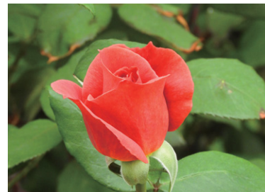
自然の中でも目を引く赤色