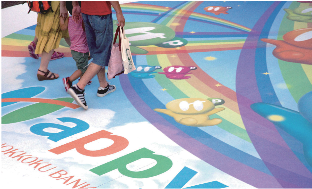
企業広告【金沢ゆめ街道2009】 サイズ：φ8000mm