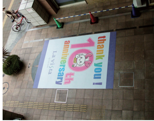
神奈川県 横浜市 W2700×H4000mm

らびすた新杉田 10周年記念の「告知広告」を店舗ファサードの路面に標示しました。ポスターやのぼり旗などの見慣れた告知媒体と異なる路面に標示された広告は、通行者の目に留まりやすく効果的な告知ができます。