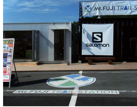
静岡県 御殿場市 W1970×H1880mm・W3280×H290mm

富士山登山口のひとつの「富士山御殿場口新五合目」のコミュニティスペースの登山者へのウェルカムサイン&ディスプレイとして路面に設置されました。路面にもディスプレイすることでコミュニティスペースに統一感ができました。