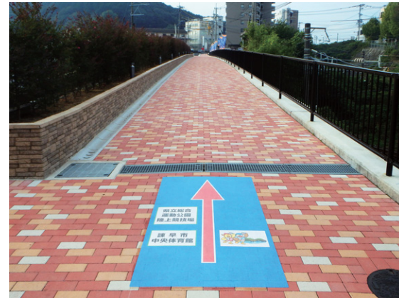
長崎県 諫早市 W1000×H2000mm

「長崎がんばらば国体2014」で、大会期間中の会場への誘導サインを路面に標示し来場者を目的場所へスムーズに誘導しました。通行の妨げにならない路面標示は安全にも配慮したサインと言えます。