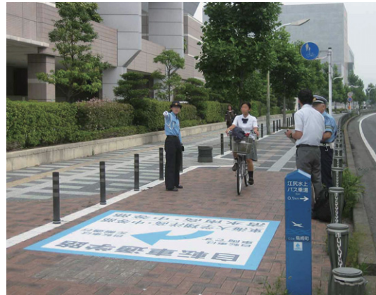
静岡県 静岡市 W2400×H2400mm

静岡県静岡市内の交通社会実験で約3ヶ月間「自転車通学路」の仮設路面標示を設置し、自転車が危険道路横断禁止を防止する検証をしました。通行の妨げにならない路面標示は安全にも配慮したサインと言えます。