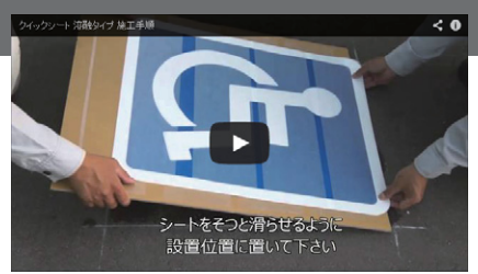
シートをそつと滑らせるように設置位置に置いて下さい