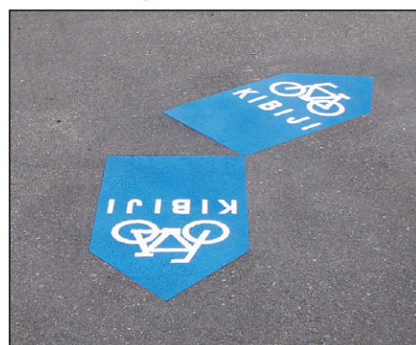
サイクリングコース 吉備路自転車道 サイズ: W400×H1500mm 設置場所: 岡山県 総社市