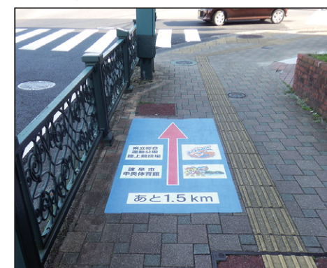
誘導サイン【長崎県諫早市中央体育館】 サイズ: W1000×H2000mm 設置場所: 長崎県 諫早市