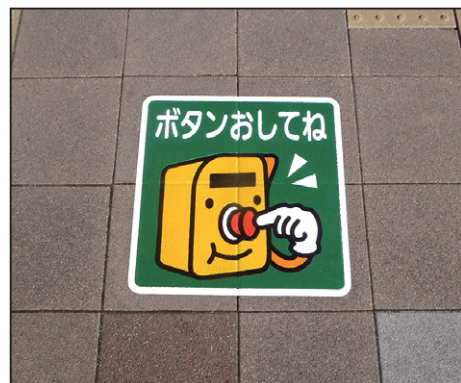
ボタンを押してね サイズ: W500×H500mm 設置場所: 静岡県 島田市