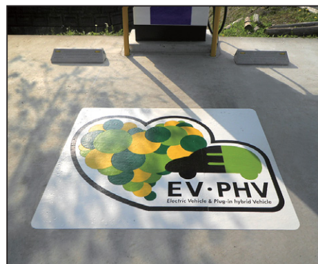
電気自動車サイン EV・PHV サイズ: W1500×H1200mm 設置場所: 佐賀県