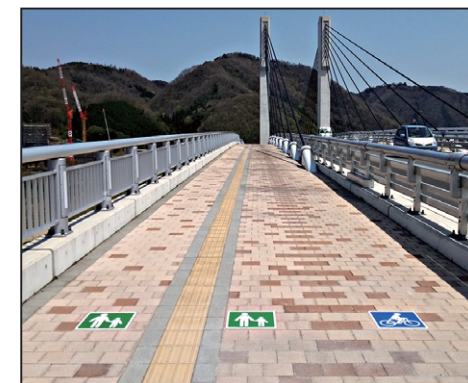
自転車・歩行者区分 サイズ: W400×H400mm 設置場所: 広島県 三次市