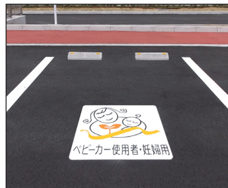
優先駐車マーク【ベビーカー利用者と妊婦用】 サイズ: W800×H800mm 設置場所: 香川県 善通寺市