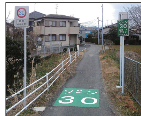
ゾーン 30 サイズ: W1500×H2000mm 設置場所: 福岡県 筑紫野市