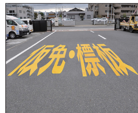
文字【仮免・標板】 サイズ: W800×H5000mm 設置場所: 福岡県