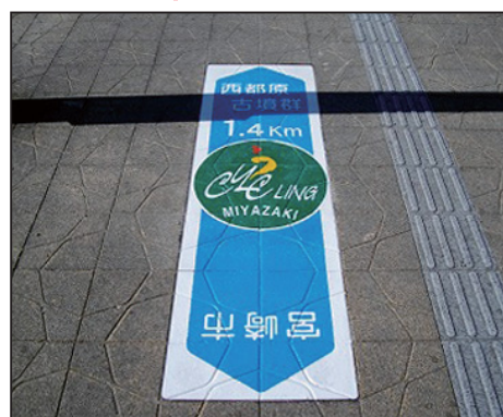
サイクリングコース サイズ: W600×H2000mm 設置場所: 宮崎県 西都市