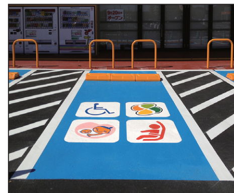
優先駐車マーク サイズ: W700×H700mm 設置場所: 福島県 須賀川市