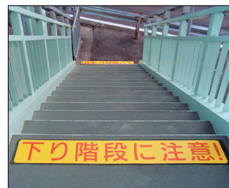
文字【上り階段に注意・下り階段に注意】 サイズ: W1350×H200mm 設置場所: 兵庫県 神戸市