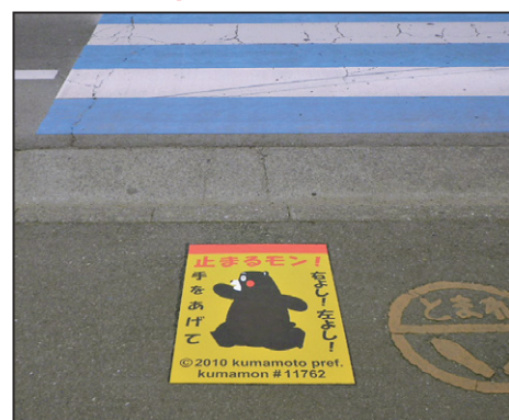
ストップマーク【くまもん】 サイズ: W550×H800mm 設置場所: 熊本県 熊本市