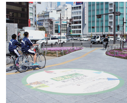
③ 家康公像(五カ国時代)前