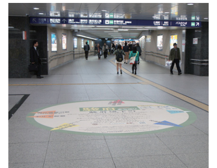
② 静岡駅北口 地下道エントランス