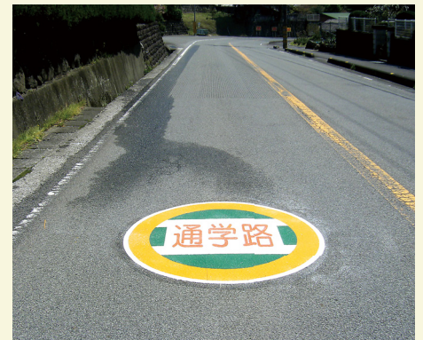
愛媛県 松野町 φ1500mm 【D-SZ-4】

現在走行している道路が通学路であることをドライバーに知らせ、注意を促す標識です。耐久性の高いクイックシートなら、交通量の多い道路にも設置でき、長期間にわたって注意を促すことができます。