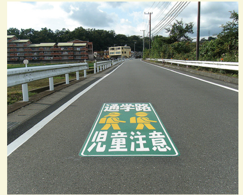
静岡県 長泉町 W1000×H3000(mm) 【D-SZ-33】