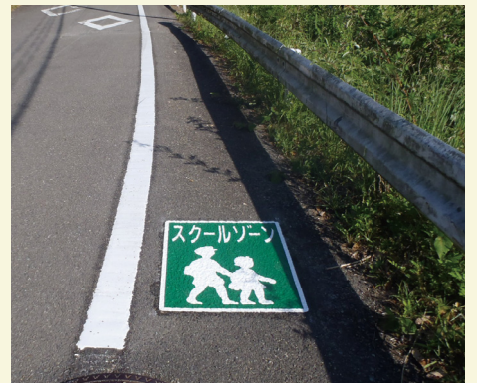
宮崎県 美郷町 W600×H800(mm) 【D-SZ-34】