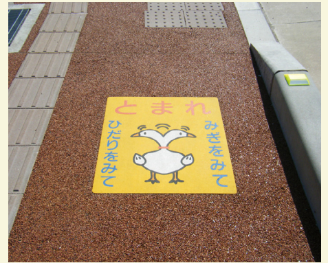
石川県 能美市 W600×H700(mm) 【D-T-59】

学校・公共施設等の出入り口や、横断歩道で子供の飛び出しによる交通事故を防止するために設置する標識です。かわいいデザインや配色は、子供の目にとまりやすく、注意喚起として効果的です。