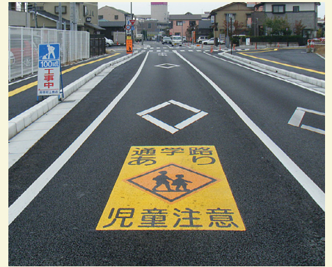
山梨県 笛吹市 W1200×H3600(mm) 【D-SZ-39】