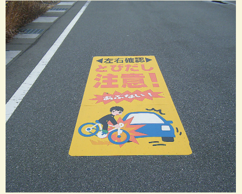
福井県 高浜町 W1020×H3000(mm) 【D-JC-9】