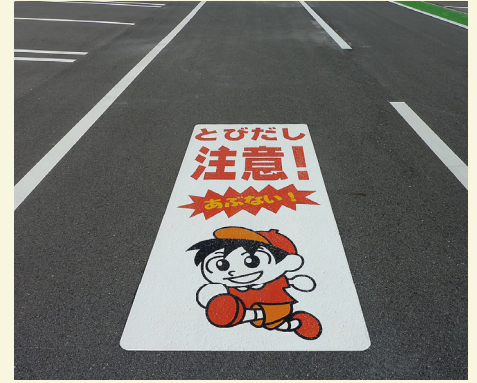
鳥取県 大山町 W1000×H2500(mm) 【D-注-78】

路地等からの子供の飛び出しに対する注意を促す標識です。路面標識なら狭い道路でも通行の妨げにならずに大きく設置できるので、運転中でも気づきやすく、ドライバーへの注意喚起として効果的です。