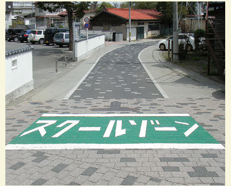
山梨県 富士吉田市 W3100×H2000(mm) 【DM-810】