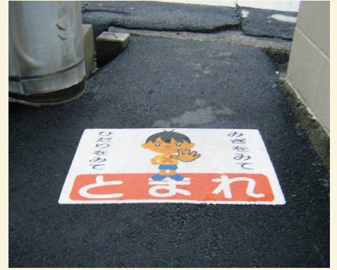
愛媛県 松山市 W600×H400(mm) 【D-T-41】