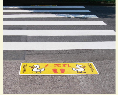
静岡県 静岡市 W400×H1200(mm) 【D-T-75】