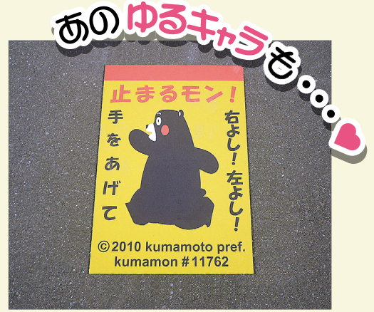
熊本県 熊本市 W550×H800(mm) 【D-R-109】