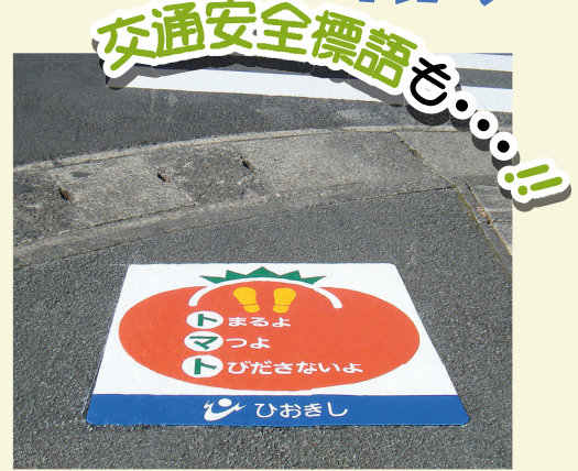
鹿児島県 日置市 W1000×H1000(mm) 【D-T-74】