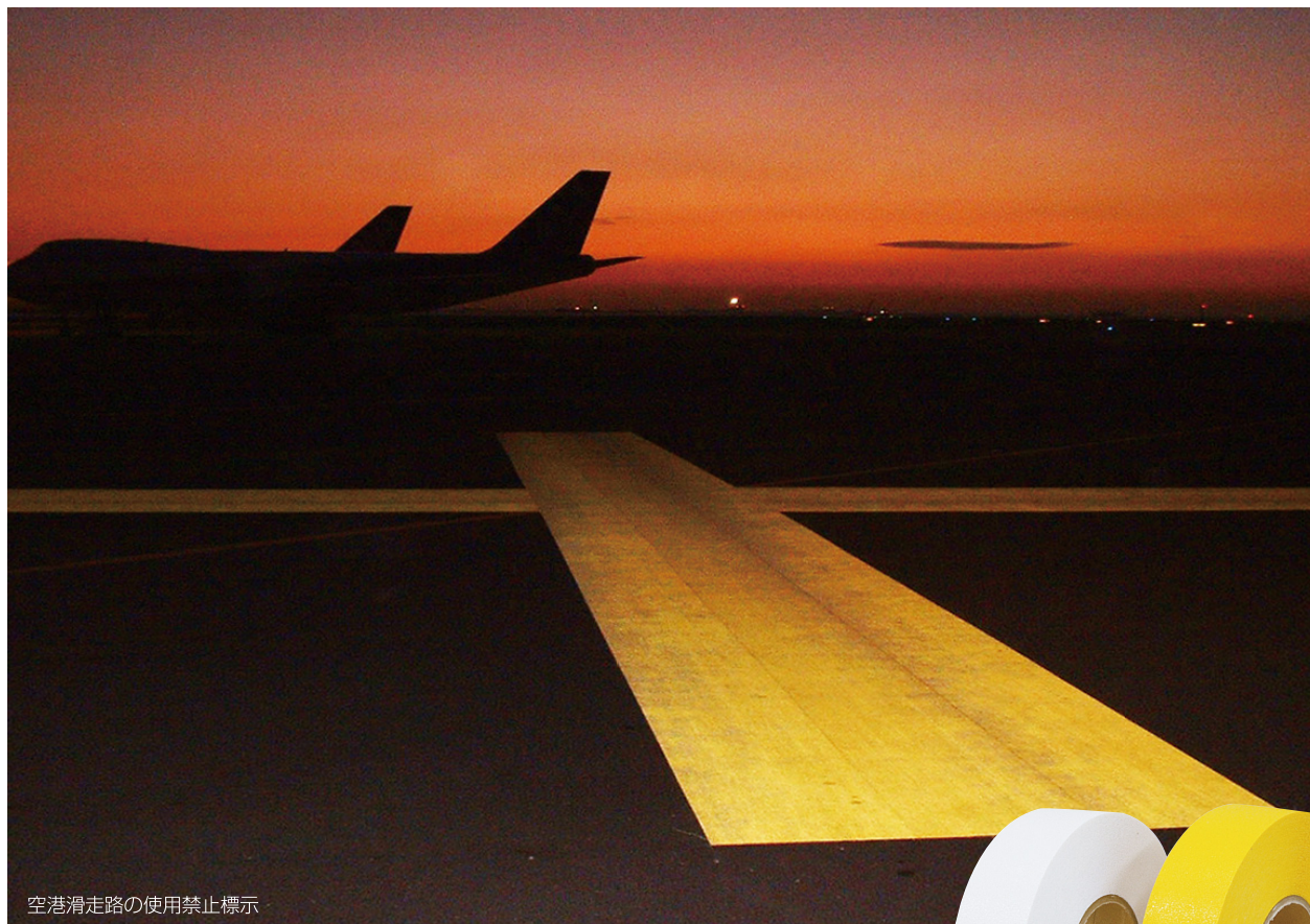
空港滑走路の使用禁止標示