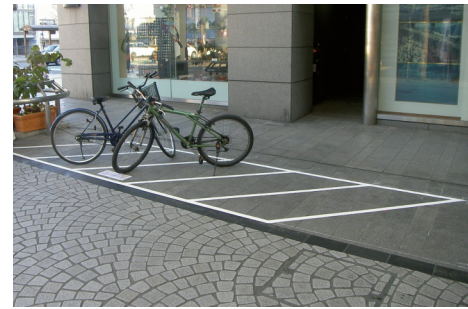
駐輪場の一時的なライン標示