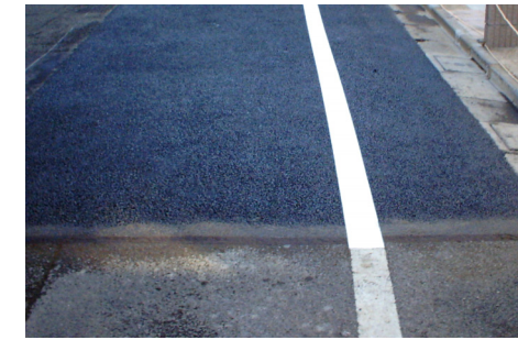
舗装直後の仮ライン標示