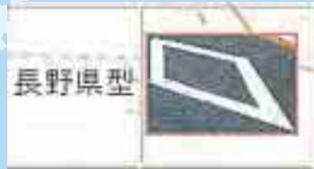
縦：5m・横：1.5m・線幅：20cm マークは1つにつながっている。