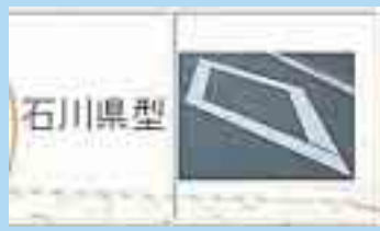
縦：5m・横：1m・線幅：20cm マークは2つに別れている。