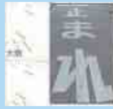
「止」は同じように標示してあるのだが、「ま」と「れ」が県によって違うことがわかる。

県によっていろいろ形がちがうものなんですね!! 横断歩道予告マークや止まれ標示以外にも、ゼブララインや自転車横断ラインの情報も掲載されていますので、興味のある方は下記のアドレスを参照してね!