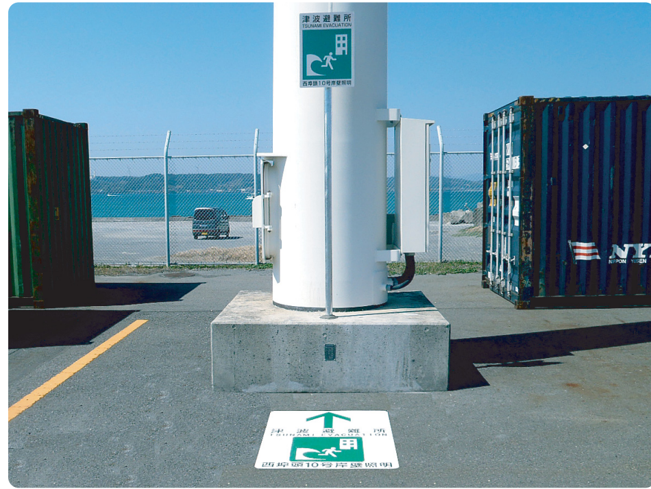
クイックシート W900×H1200mm 静岡県

当社の クイックシート を用いた「路面サイン」は設置場所を選ばず、沿岸施設等、様々な場所での的確な注意喚起・避難誘導が可能で、災害対策として高い効果が期待できます。