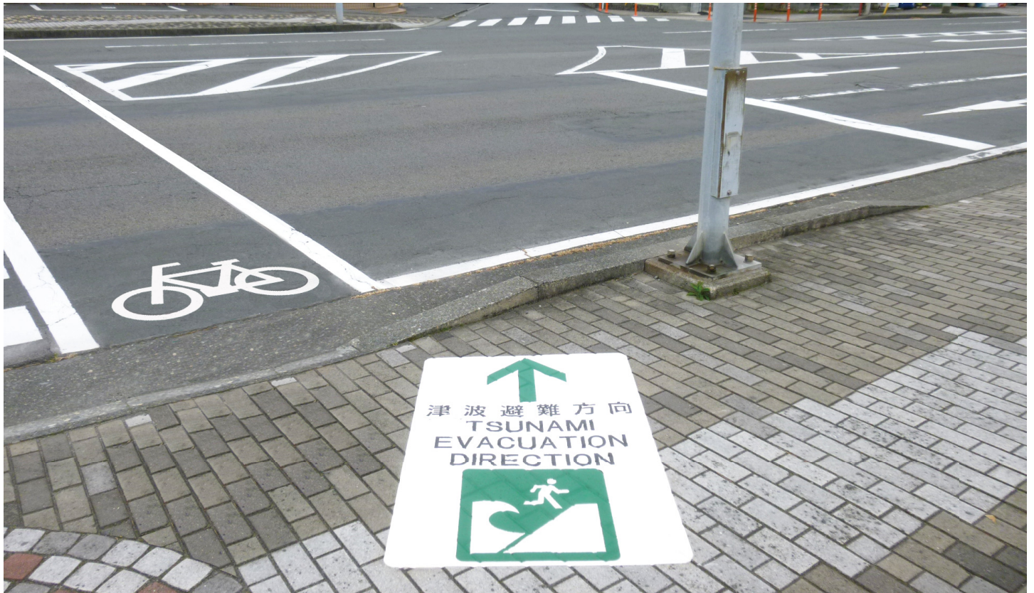
津波避難誘導 静岡県 伊東市 W900×H1400mm 【D-HS-123】

地震、津波、洪水、大規模火災などの災害前・災害時の防災・減災対策の一つとして 当社、屋外路面シート製品「クイックシート」、「パルシート」を活用した「災害を学 習・啓発する」「避難場所を知る」「避難場所へ誘導する」3テーマでご提案します。