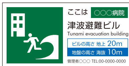
津波避難ビル 記名サイン