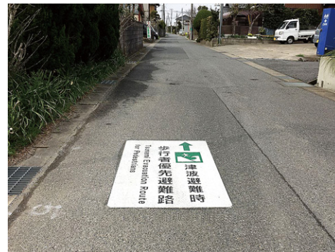
千葉県 大網白里市 W900×H1400mm 【D-HS-220】