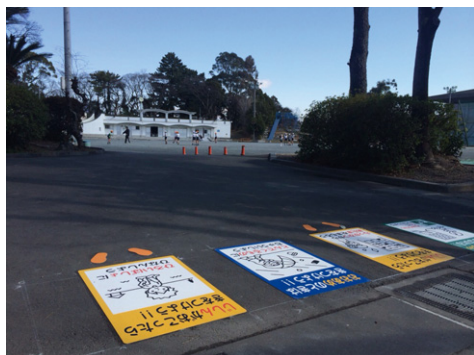
静岡県 静岡市 W600mm×H900mm 【D-注-127】