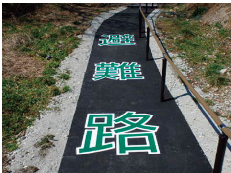
宮城県 宮城郡 七ヶ浜町 W1000 × H1000mm(1文字) 【DM-934】