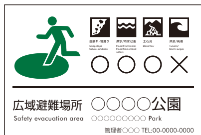
広域避難場所 記名サイン