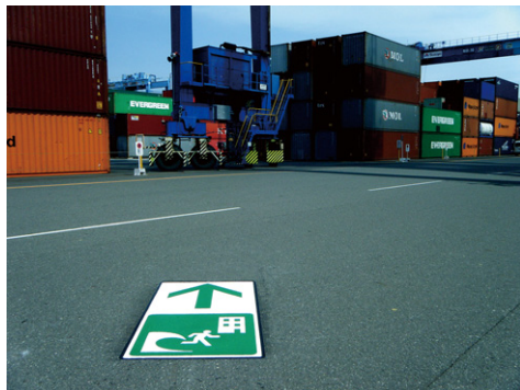
静岡県 静岡市 W1000×H2000mm 【D-HS-57】