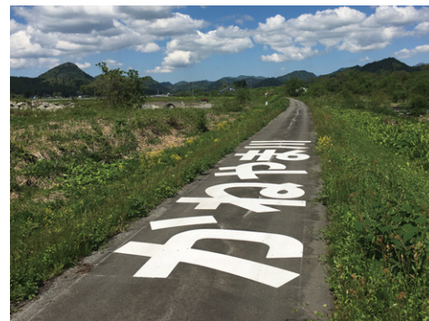
山形県 金山町 W2000×H2000mm(1文字)