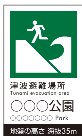
津波避難場所 記名サイン