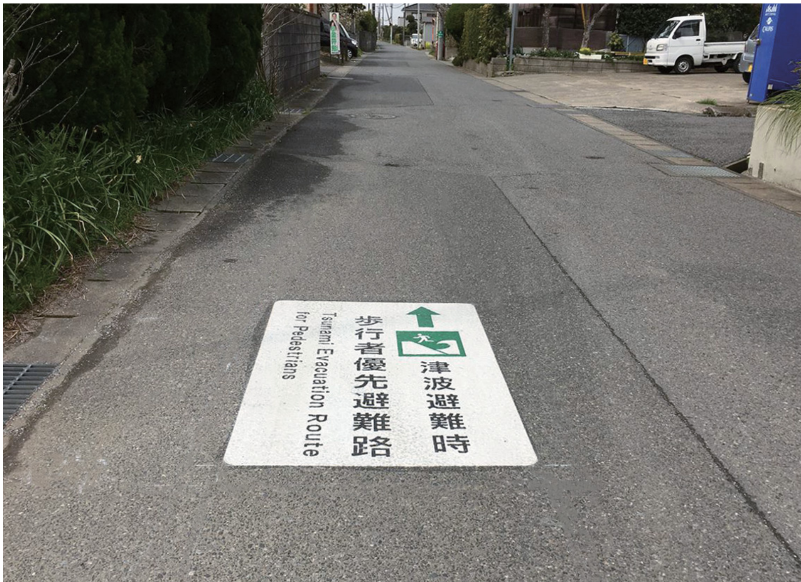
津波避難時・・・

施工場所：千葉県 大網白里市 サイズ：W900×H1400mm データ番号：D-HS-220