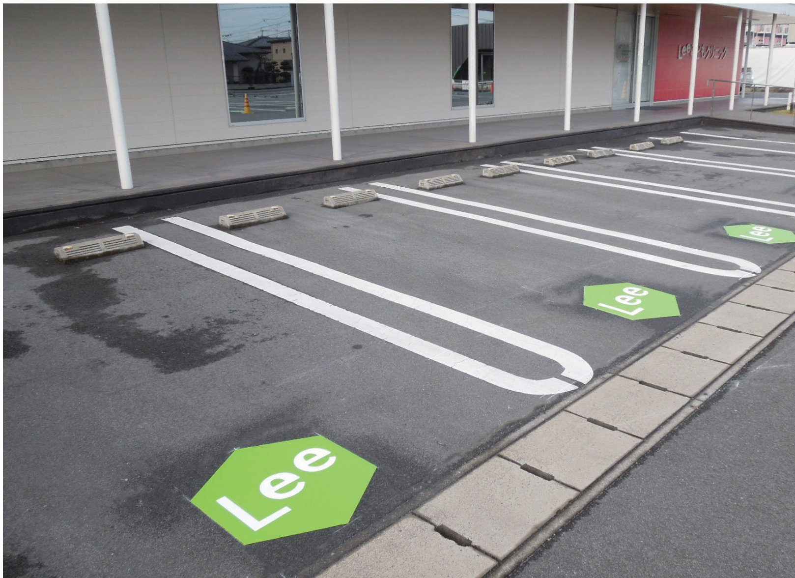
クリニック駐車場

施工場所：熊本県 合志市 サイズ：W600×H700mm データ番号：DM-1522