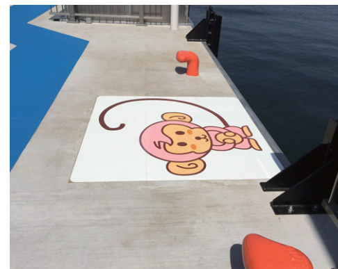
横須賀港・かもめえ

施工場所：神奈川県 横須賀市 サイズ：かもめえ φ2500mm さる W1500×H1500mm データ番号：D-R-172 / D-L-98