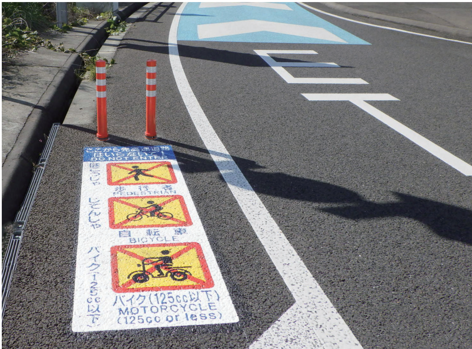
ここから先高速道路

施工場所：福井県 敦賀市 サイズ：W700×H2200mm データ番号：D-注-237