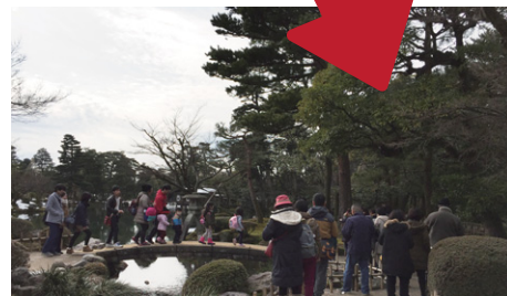
兼六園ことじ灯籠前の写真撮影列

その他に、変わったと感ずることに、「天気予報で“金沢”が表記されるようになった」、「テレビでよく石川県をよく見るようになった」との声もありました。アクセスしやすくなったため、注目も高まっているようです。またその反面、以前と比べ混雑した金沢駅や市内中心部に「行きにくくなった」などの声もありました。予想以上の人の多さに困惑しながらも、「こんなに人が集まるいい所だったのか」と改めて気づき、北陸新幹線開業効果を実感しています。