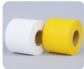
W150mm×46m巻 ※1ケース 4巻入り