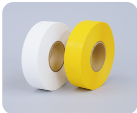
W50mm×46m巻 ※1ケース 12巻入り