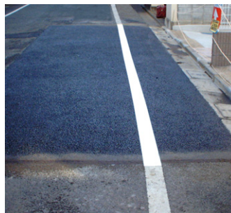
舗装直後の仮ライン標示