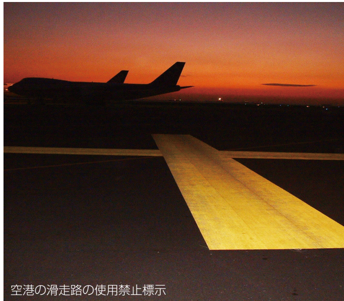
空港の滑走路の使用禁止標示