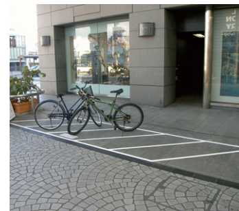
駐車場の一時的なライン標示