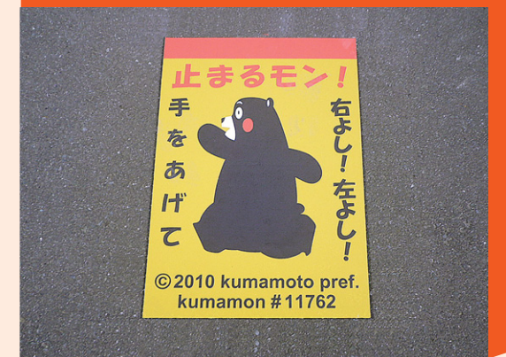
クイックシート 熊本県 熊本市 W550×H800mm