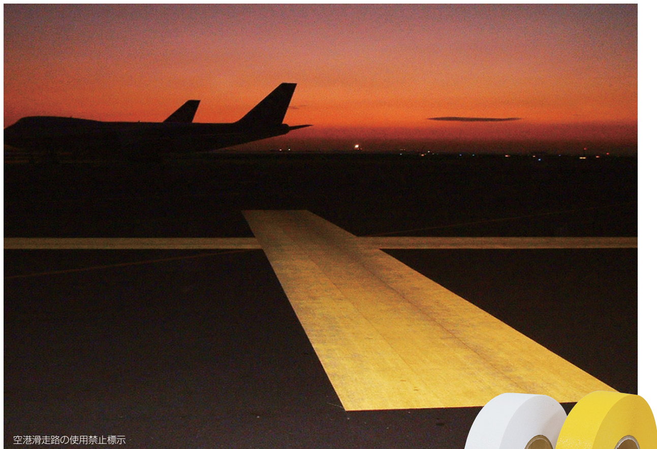
空港滑走路の使用禁止標示