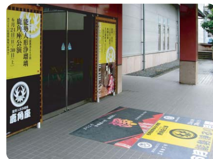
施設入口にイベント広告を告知 施工場所：大阪府・大阪浄瑠璃シアター 様