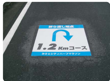
道路にシティマラソンの折返し地点サインを設置 施工場所：埼玉県・みさとシティハーフマラソン 様