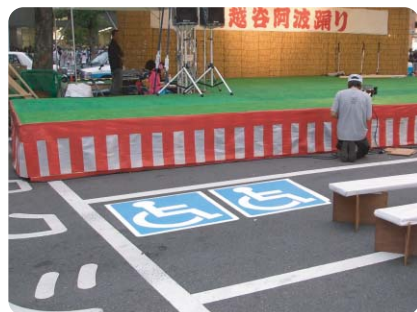
イベント会場内に仮の身障者スペースを設置 施工場所：埼玉県・南越谷阿波踊り会場 様