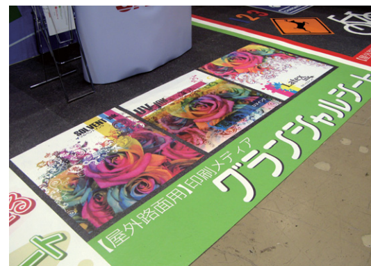
グランシャルシートの印刷別サンプルを設置しました。左からソルベントインク、UV インク、ラテックスインクの3種類です。