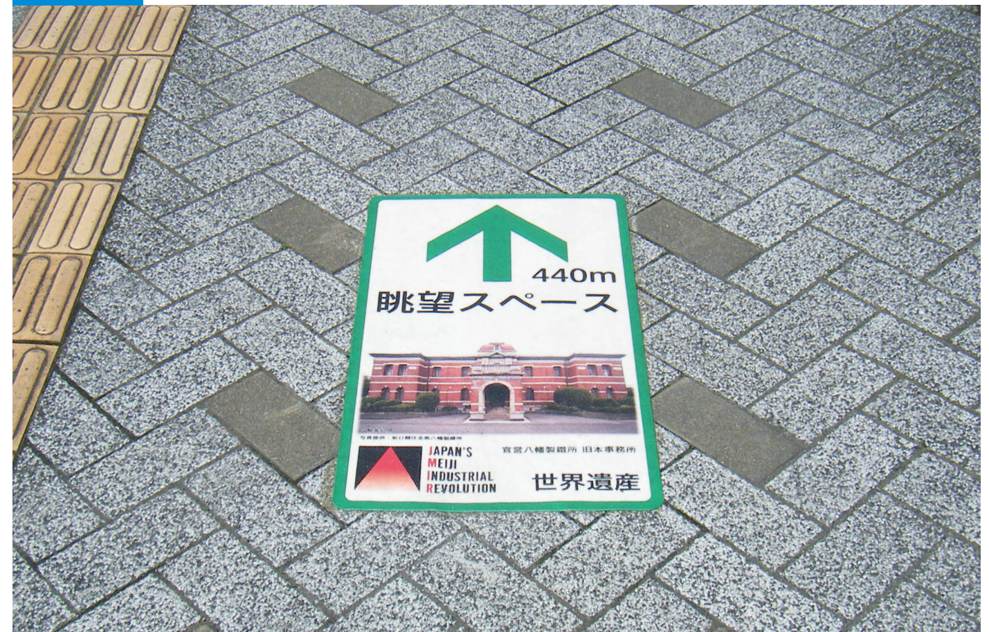
屋外路面 印刷シート