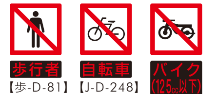
歩行者 自転車 バイク 【歩-D-81】 【J-D-248】 (12.5cc以下)