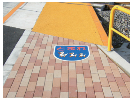
【ストップマーク】 福井県 W600×H600mm