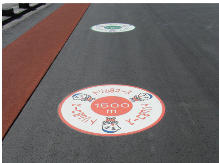
【案内・距離サイン】 愛知県 Φ1200mm