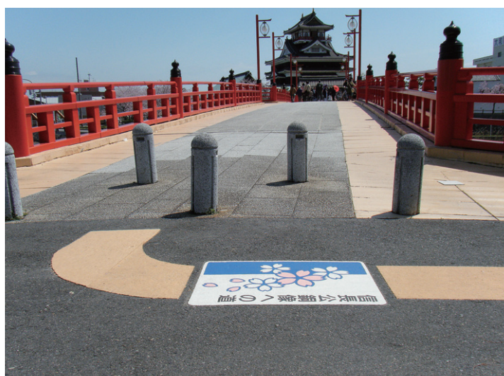
【案内サイン】 愛知県 W600×H800mm