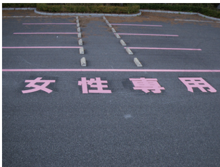
【規制案内】 福島県 W1000×H1000mm (1文字)