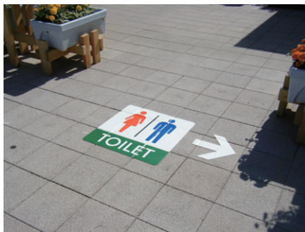
【誘導サイン】 福井県 W600×H600mm